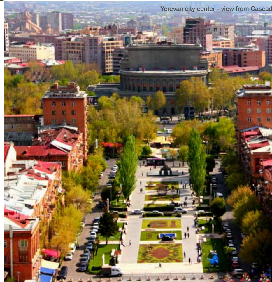
Yerevan city center - view from Cascade

En toile de fond de la capitale, passé le centre ville moderne entièrement reconstruit, le mont Ararat culmine majestueusement à 5.156 mètres d'altitude juste au-delà de la frontière turque. Selon la Bible, c'est là que se serait posée l'arche de Noé. C'est depuis le haut de la Cascade à Erevan, mais aussi depuis la vallée d'Ararat, qui constitue le point géographique le plus bas de l'Arménie et qui s'étend jusqu'au pied de la montagne, qu'on a une vue à couper le souffle sur ses deux sommets