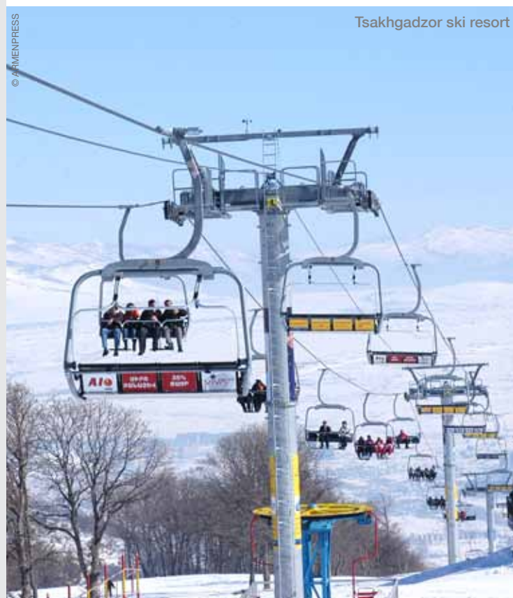
Tsaghkadzor ski resort

Situé à 1.900 mètres dans la montagne, le lac Sevan est l'un des plus vastes lacs d'altitude du monde. À moins d'une heure de route au nord est d'Erevan, ce lac a de quoi ravir tant les amateurs d'aventure que les passionnés d'histoire: la région se prête à des randonnées exceptionnelles, les stations balnéaires sur les rives du lac invitent