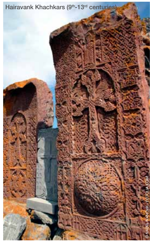
Hairavank Khachkars (9th-13th centuries)

AT THE CROSSROADS OF EUROPE AND ASIA, ARMENIA IS A YOUNG REPUBLIC WITH 22 YEARS OF INDEPENDENCE, WHOSE PEOPLE CHERISH THEIR ANCIENT ARMENIAN HISTORY AND CULTURE. IN ANCIENT AND EARLY MEDIEVAL TIMES THE ARMENIAN KINGDOMS STRETCHED FROM THE EASTERN MEDITERRANEAN ACROSS ASIA MINOR TO THE SOUTH CAUCASUS, SHAPING THE APPEARANCE AND CULTURE OF THE WORLD'S FIRST CHRISTIAN COUNTRY.