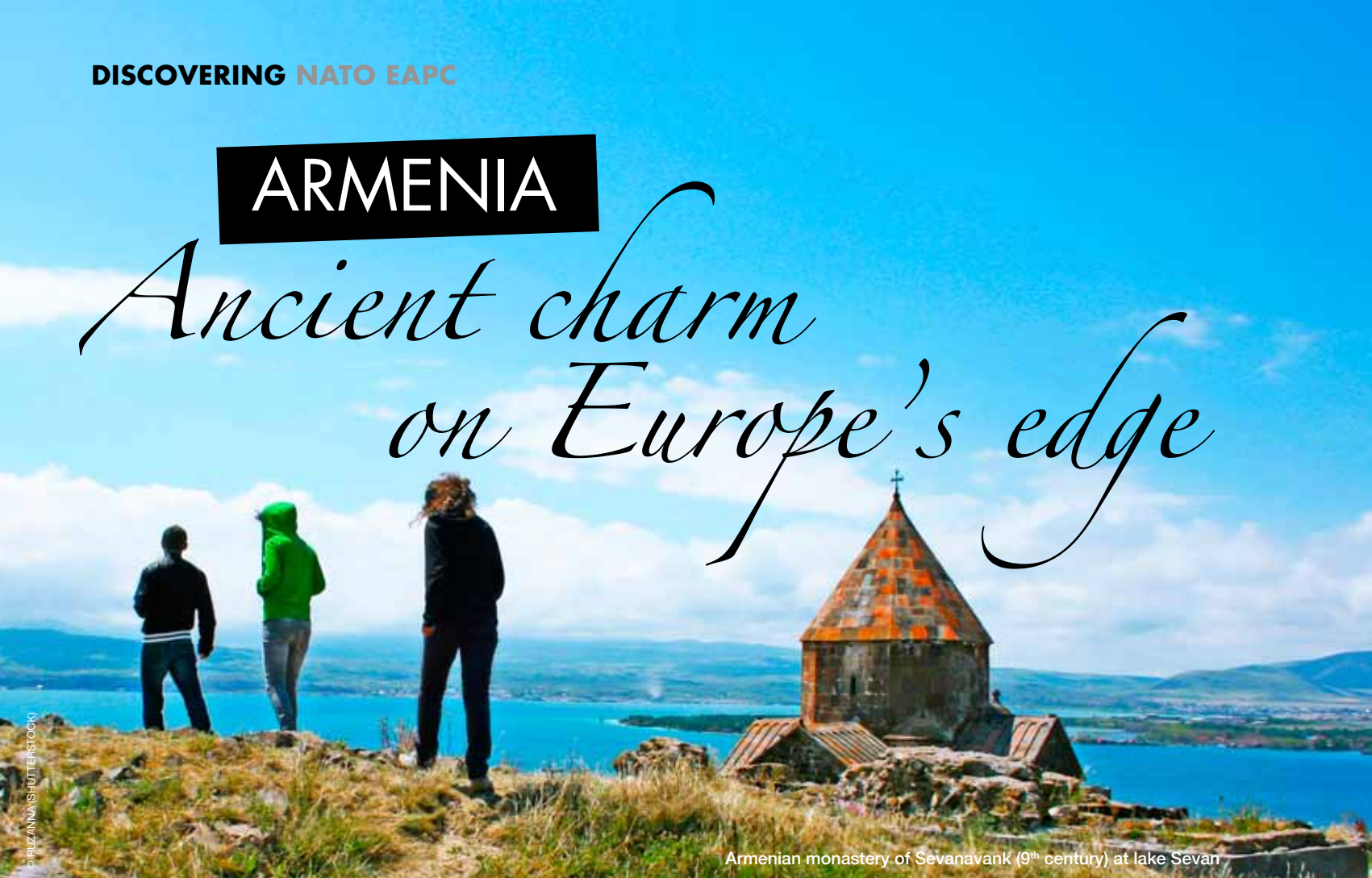
Armenian monastery of Sevanavank (9th century) at lake Sevan