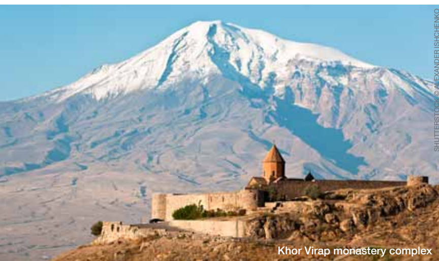
Khor Virap monastery complex

No visas are required for tourists who are citizens of the EU or the CIS (Community of Independent States). Citizens from most other states can obtain their tourist visas at the airport upon arrival. For more information please consult your Foreign Ministry's travel information or nearest embassy of Armenia.